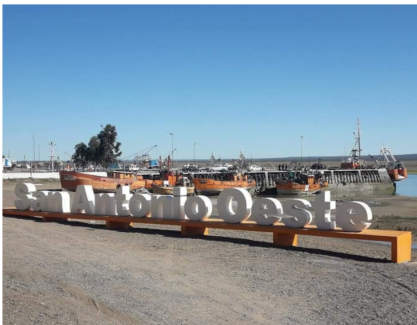
Imagen 2: Imagen de San Antonio Oeste, ciudad cabecera del distrito.

Para abordar la temática es más que relevante aclarar que la base de todo destino turístico inteligente es una planificación turística sustentable, consensuada entre todos los actores directa e indirectamente vinculados a la actividad turística. En el caso de la Municipalidad de San Antonio Oeste, les contaba que en el 2018 se comenzó a trabajar en un Plan Estratégico de Turismo Sustentable, donde se partió de un diagnóstico real de la situación del ejido que comprende las tres localidades mencionadas, cada una con sus particularidades.