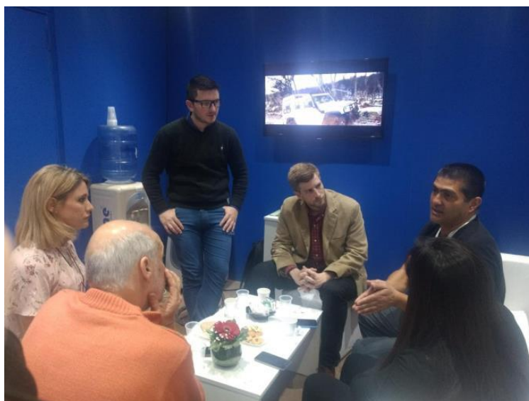
Imagen 3. Reunión en la FIT 2019 durante la elaboración del Plan Estratégico para el Desarrollo Turístico Sustentable de San Antonio.

Cabe destacar que cuando el equipo de trabajo encargado de dirigir el plan estratégico empezó a abordar la temática de destino turístico inteligente, este concepto era muy poco conocido o no estaba aún instalado, al menos en Argentina. Se entiende, desde la mirada de un municipio, a un destino turístico inteligente como un territorio accesible para todos, donde la innovación continua genera un desarrollo sostenible, teniendo en cuenta los aspectos económicos, socioculturales y ambientales. Y las políticas a implementar para lograr la total conversión tienen que ver con: accesibilidad en todos los elementos de valor de la cadena turística, la innovación para profundizar las ventajas competitivas de las experiencias turísticas del destino, la responsabilidad social, la sustentabilidad y las tecnologías para la mejora en los procesos.