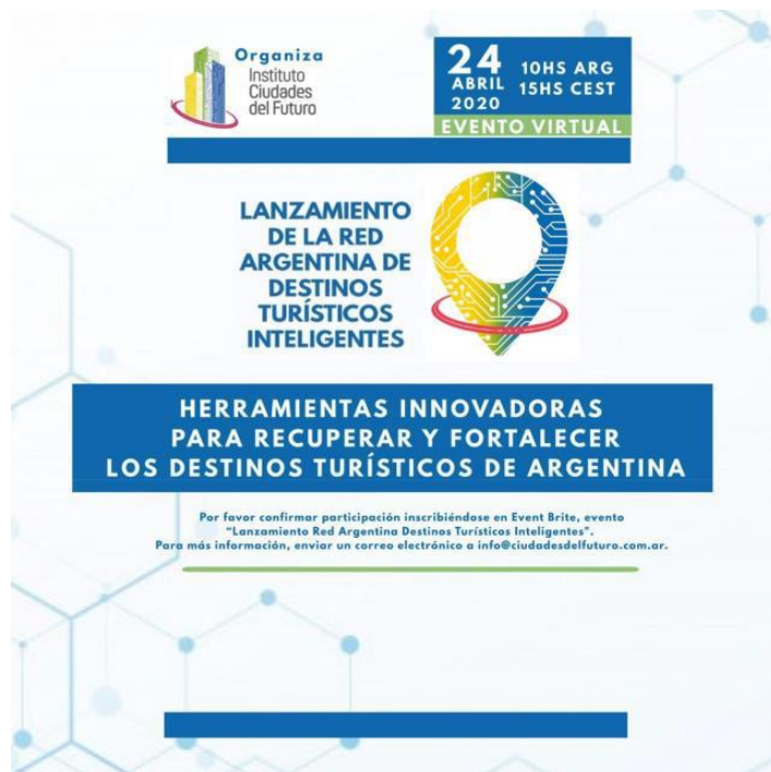
Imagen 5: Afiche de lanzamiento de la Red Argentina de Destinos Turísticos Inteligentes.

Cada uno de nosotros somos un comunicador más. Somos capaces de generar información concreta para otros.