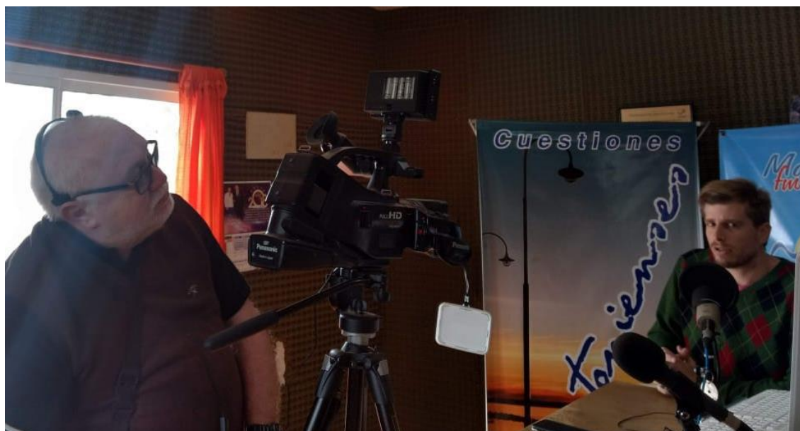
Imagen 4: Entrevista mantenida durante la elaboración del Plan Estratégico de San Antonio.

Más allá de que hablamos de destinos turísticos inteligentes, también los comunicadores deberán formarse en este sentido. Les cuento un caso que me pasó a mí. Muchas veces sucede en el interior del país que se cree que la comunicación es la elaboración de una gacetilla y su envío y publicación, cuando, en realidad, es algo mucho más complejo que eso.